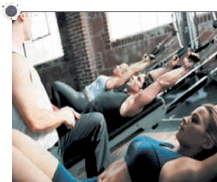
Figura 1 Gravity system.

che si eseguono sul Reformer . Il GTS consente di lavorare sulla qualità e sulla creatività legata ai principi originali del Pilates®, ma con i vantaggi di uno strumento disegnato e concepito con innovativi concetti di biomeccanica (figura 1). Il Pilates® eseguito su Gravity sfrutta il concetto di gravità, di resistenza e assi-